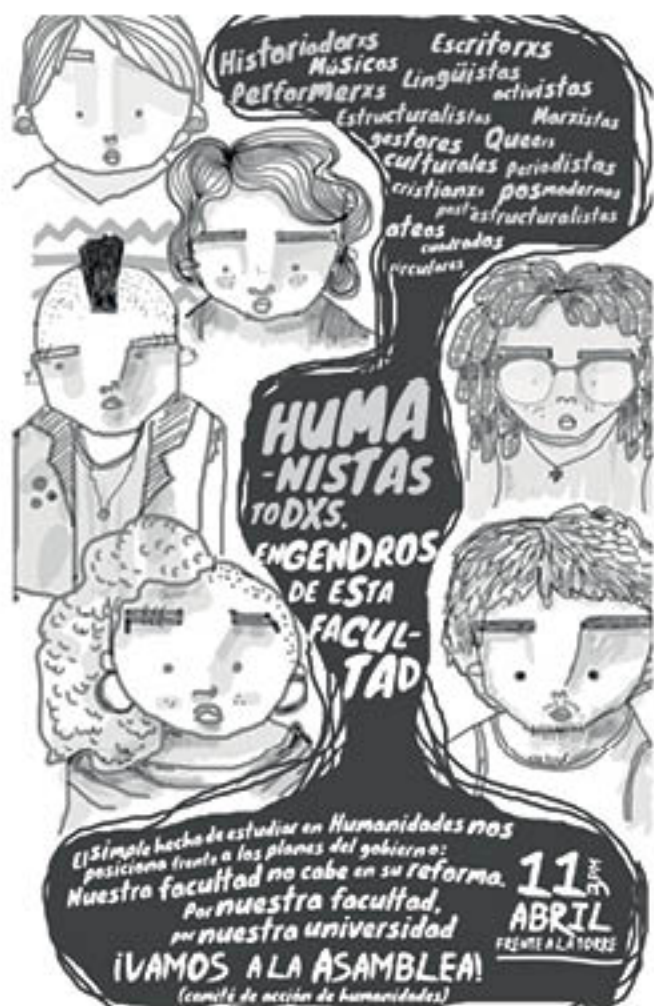
YUIZA MARTÍNEZ RIVERA (Puerto Rico) Engendros de Humanidades: Assembly poster, 2012 Digital print on single weight board, 9" x 12"